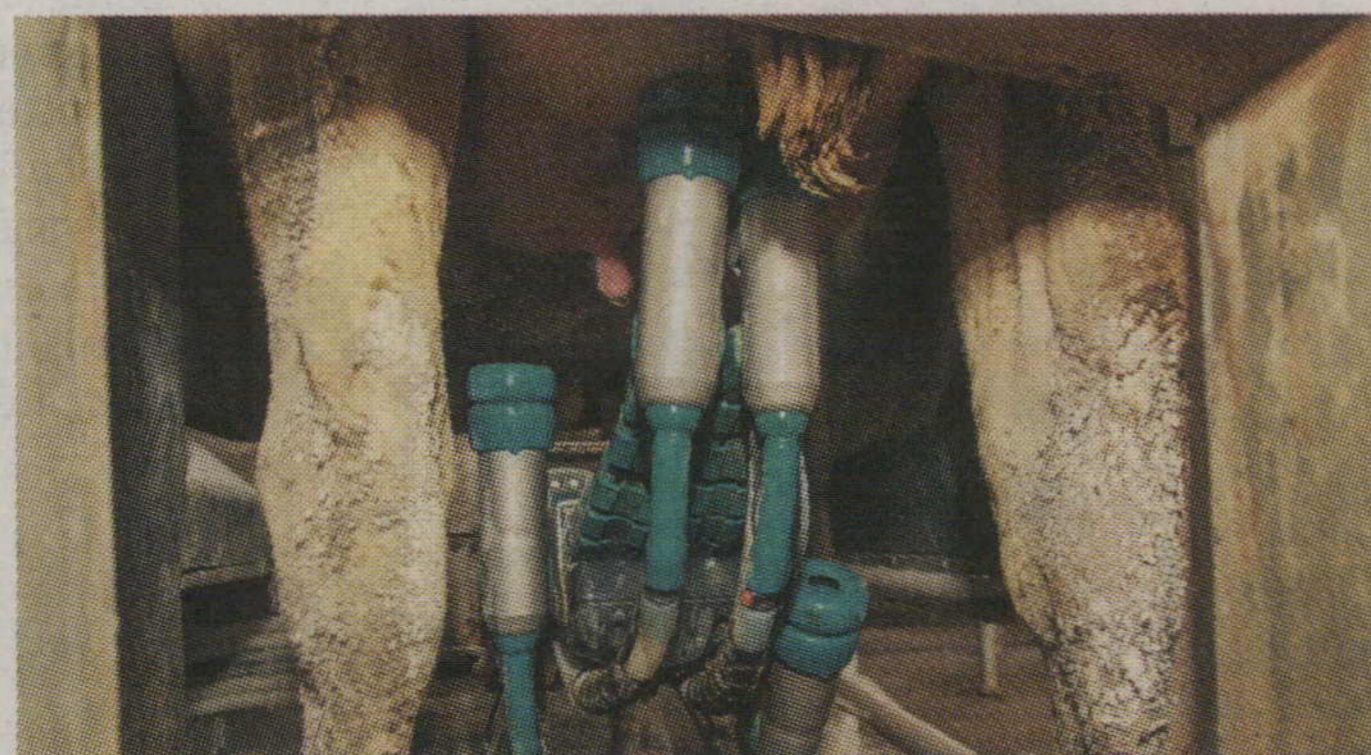
VISAS DARBĪBAS - stobriņu pielikšana, atslaukšana, starpslaukšanas, pēcslaukšanas dezinfekcija - notiek automātiski.