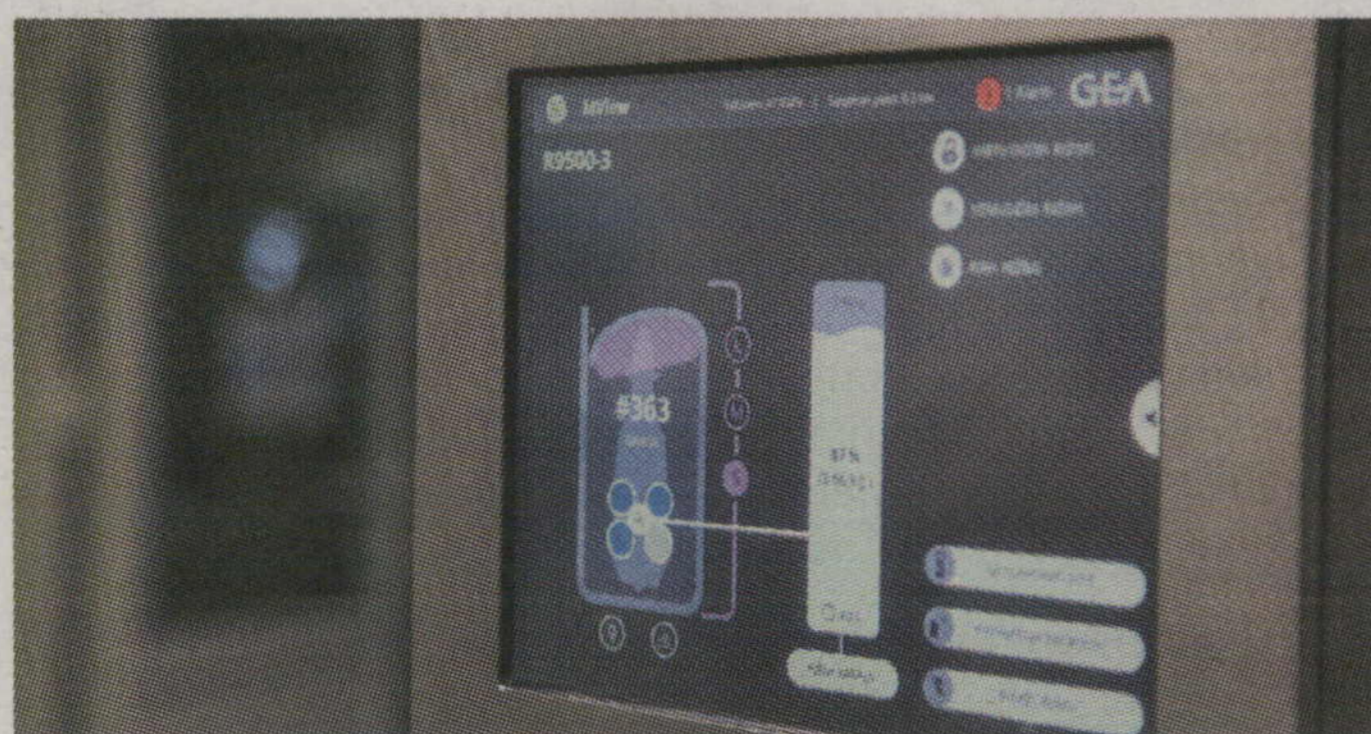
GOVIS PAŠAS IET pie slaukšanas robota, datora ekrānā var sekot slaukšanas procesam.