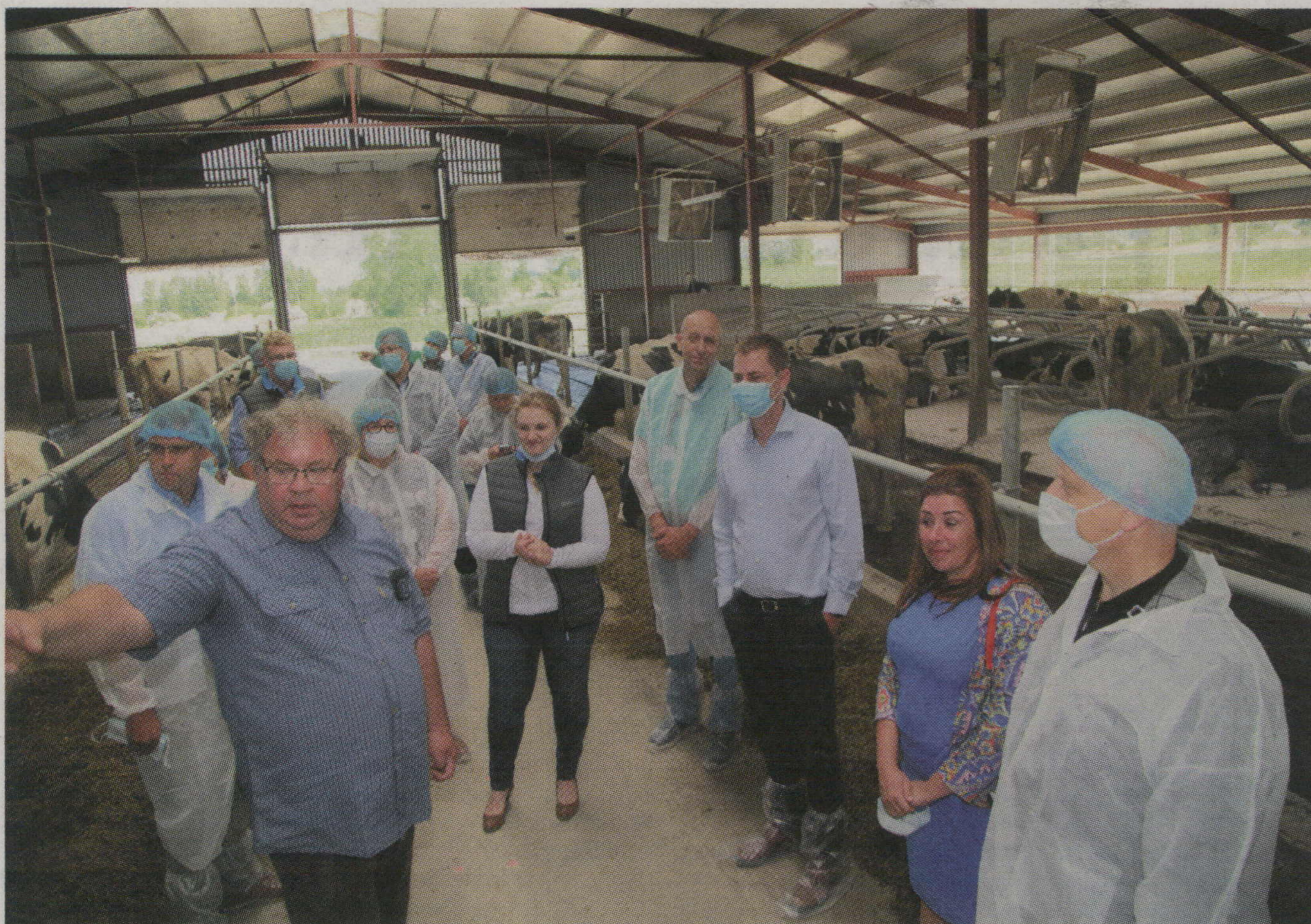
LOPU NOVIETNĒ vienmēr ir vajadzīgs aizsargtērps, bet tagad arī ārpus tās tiek ievēroti ierobežojumi.